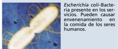
Escherichia coli —Bacteria presente en los servicios. Pueden causar envenenamiento en la comida de los seres humanos.

Las prácticas de higiene general, especialmente en la higiene de las manos, de la comida y de las superficies, ayudan a controlar la transmisión de los gérmenes. Los productos de limpieza específicos con activos biocidas ayudan a reducir y prevenir la contaminación microbiológica en las áreas de alto riesgo y minimizan la contaminación cruzada en determinados momentos críticos.