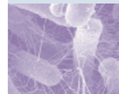
Salmonellen – La bacteria encontrada más frecuentemente en la comida. Puede causar enfermedades en los seres humanos y en muchos animales (por ejemplo, fiebre tifoidea y salmonelosis).

La comida y la bebida y las industrias de catering y hospitalarias son también grandes usuarios de productos desinfectantes. Incidentes con, por ejemplo, Salmonela en los huevos y las aves y Listeria en los productos diarios, demuestran la importancia de mantener condiciones estrictas de higiene en la manipulación de la comida y su procesado con el fin de evitar enfermedades generadas por dicha comida.