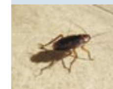
Las cucarachas pueden transmitir, debido a su contacto con comida en mal estado, varios patógenos peligrosos para los seres humanos.